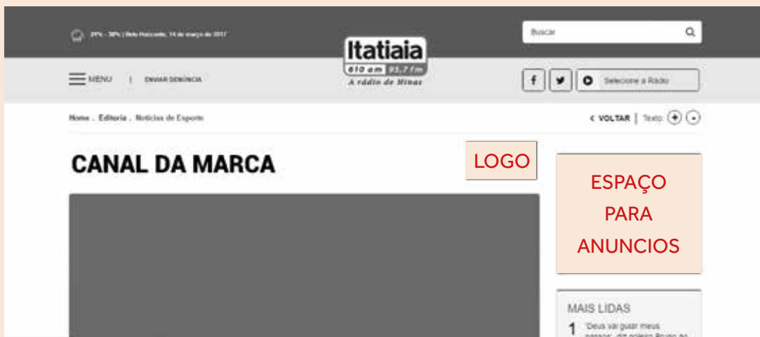
TABELA DE VALORES Canal Co-Branded

Tenha um canal completo de com vídeos, imagens e textos, com conteúdos variados sobre assunto relacionado ao público do anunciante. A página e o conteúdo são construídos de forma a levar o seu cliente a encontrar sua marca quando ele busca informações sobre um tema específico, seja ele finanças, educação, saúde, veículos, gastronomia, entre outros.